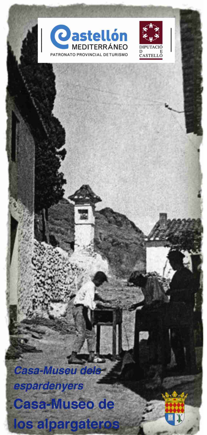
Casa-Museu dels espardenyers Casa-Museo de los alpargateros