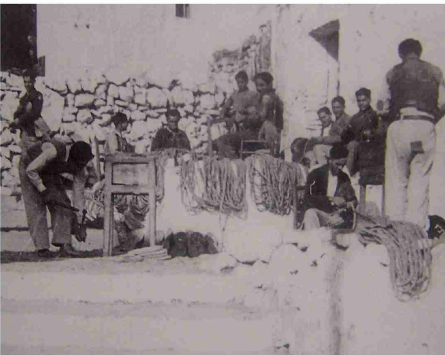
Alpargateros al final de la calle Calvario. Aprox.1930.

Durante 2010 este inmueble, de propiedad municipal, fue objeto de una cuidada restauración, a cargo de un Taller de Empleo local. Y en junio del mismo año se realizaron en él dos prospecciones arqueológicas. Estas excavaciones permitieron datar el inicio del inmueble en los comienzos del siglo XIV, en medio de un contexto islámico que perduraría hasta la expulsión de los moriscos, 1609.