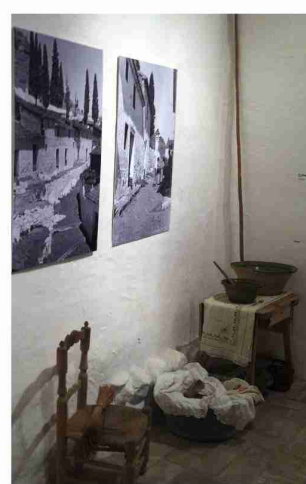
Segunda Estancia Destinada a la cocina

Fotografías de alpargateros y alpargateras, distribuidas por toda la casa, y videos sobre la artesanía, nos acercan a este entrañable mundo, y hacen posible que este importante legado etnográfico sea valorado convenientemente y cobre vida.