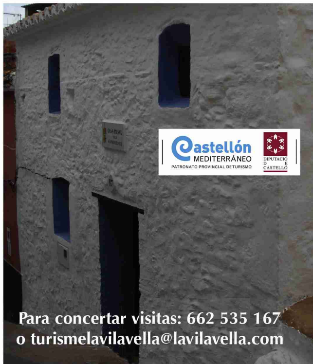
Casa-Museu dels Espardenyers - Calle La Cárcel, 17 12526 La Vilavella (Castellón)